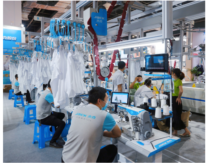
Nicht nur Exporte: China produziert mehr Waren für die eigene Bevölkerung

Bei der Digitalisierung ist das Land bekanntlich ohnehin schon deutlich weiter als etwa Europa. „In China entstandene Produkt-