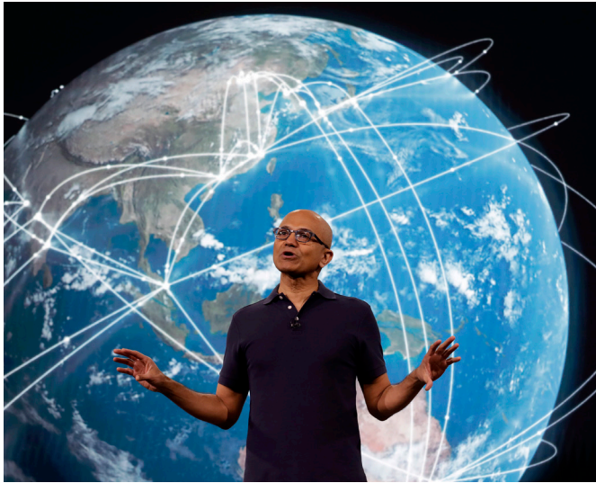
Microsoft-Chef Nadella: Im Metaverse verschmelzen digitale und reale Welt

Die Experten der US-Investmentbanken Morgan Stanley sehen zwar noch eine Reihe von technischen und regulatorischen Hürden, die der virtuelle Raum zu überwinden hat. Aber in einem Memo an Investoren prognostizieren sie allein für Anwendungen im Immobilien-, Verkehrs- und Bildungsbereich langfristig ein Marktvolumen von acht Billionen Dollar in der 3D-Welt. Dazu kommt das lukrative Geschäft mit Gaming und dem Handel mit digitalen Echtheitszertifikaten (Non-Fungible-Tokens, kurz NFTs).