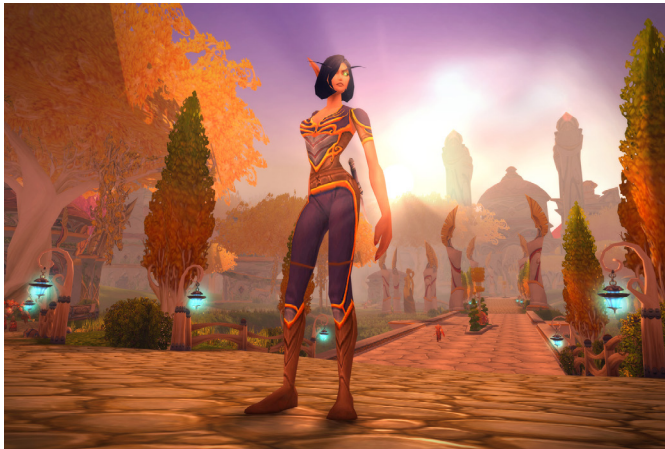
World of Warcraft: Fans der Blutelfen können diese im Metaverse treffen