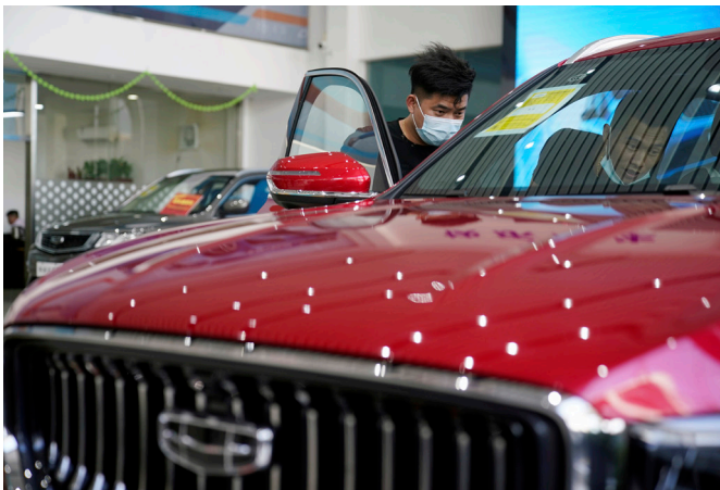
Made in China: Bei Elektroautos ist die heimische Marke Geely sehr begehrt

Da geht die harte Konkurrenz ganz so zu wie bei den Olympischen und Paralympischen Spielen, die in diesen Tagen noch das Straßenbild in Peking bestimmen – obwohl dort groß das Motto plakatiert ist: „Zusammen für eine gemeinsame Zukunft“.