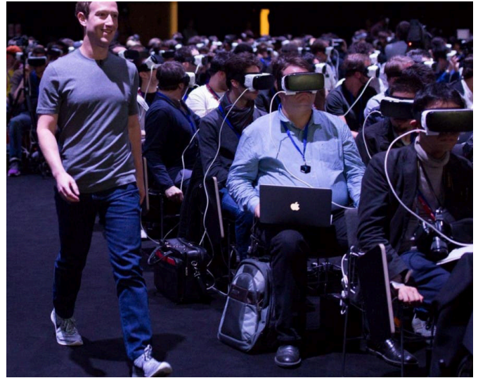
Mark Zuckerberg: So will der Meta-Chef seine User künftig sehen

Der reale Handel mit digitalen Zertifikaten kommt derzeit rasant in Schwung. Immer häufiger werden Bilder oder andere Kunst- und Sammelobjekte digitalisiert und in eine limitierte Zahl von NFTs transformiert. Jeder Token repräsentiert eine kleine Fläche am Gesamtwerk und ist per Blockchain-Technologie eindeu-