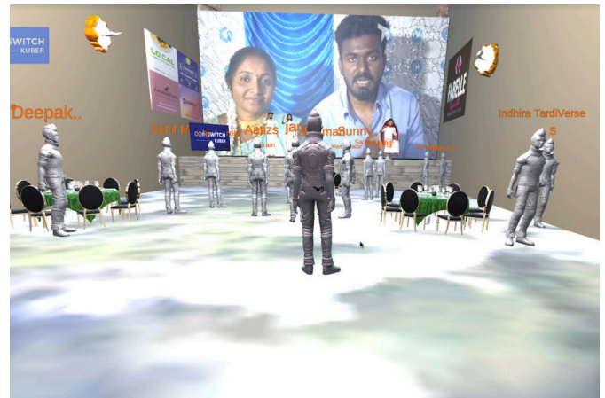
Grafisch ausbaufähig: Indisches Paar feierte Hochzeit im Metaverse-Schloss

Welche Möglichkeiten und Erlebnisse ein Metaverse heutiger Prägung bieten könnte, hat publikumswirksam der Film „Ready