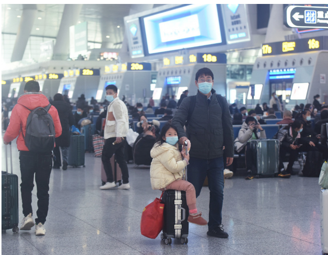
Inlandsreisen wieder erlaubt: China kämpft gegen die Konjunkturschwäche

Bis zum Ende auch der Paralympics – und der Abreise aller ausländischen Besucher – ist Abschottung noch alternativlose Linie der